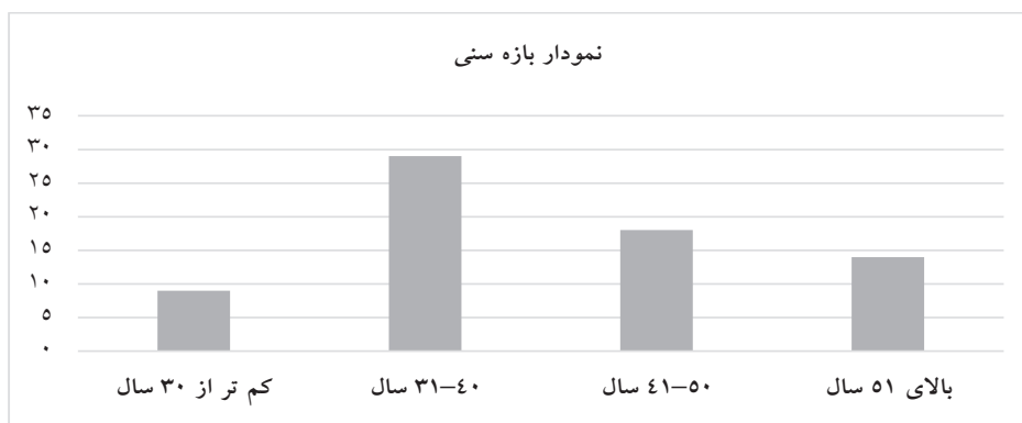
نمودار ۱: توزیع بیماران مبتلا به NMO براساس گروه‌های سنی

بررسی ۱۱/۳۷ سال با انحراف معیار ۲/۱۵ سال بود و ۹۰٪ آن‌ها مدرک تحصیلی دیپلم یا پایین‌تر و حدود ۱۰٪ تحصیلات دانشگاهی داشتند. توزیع گروه‌های سنی بیماران مبتلا به NMO در نمودار ۱ مشخص شده است.